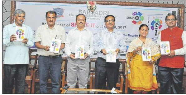
ಮಂಗಳೂರಿನ ಸಹ್ಯಾದ್ರಿ ಕಾಲೇಜಿನಲ್ಲಿ ‘ಶೇಪ್ ಇಟ್’ ಪುಸ್ತಕವನ್ನು ಶನಿವಾರ ಬಿಡುಗಡೆ ಮಾಡಲಾಯಿತು.

‘ಪ್ರತಿ ದಿನವೂ ಉದ್ಯಮ ಕ್ಷೇತ್ರದಲ್ಲಿ ಬದಲಾವಣೆ ಆಗುವುದನ್ನು ಕಾಣುತ್ತೇವೆ. ಅದಕ್ಕೆ ಅನುಗುಣವಾಗಿ ತಂತ್ರಜ್ಞಾನ ಬಳಕೆ ಮಾಡಿಕೊಳ್ಳುವತ್ತ ಗಮನ ಕೇಂದ್ರೀಕರಿಸಬೇಕು. ಎಂಜಿನಿಯರಿಂಗ್ ವ್ಯಾಸಂಗ ಮಾಡುವ ವಿದ್ಯಾರ್ಥಿಗಳು ಉದ್ಯಮ ಕ್ಷೇತ್ರದಲ್ಲಿ ಆಗುವಂತಹ ದಿನ ನಿತ್ಯದ ಬದಲಾವಣೆಗಳನ್ನು ಸೂಕ್ತವಾಗಿ ಗಮನಿಸುವ ಗುಣ ಬೆಳೆಸಿಕೊಂಡಾಗ ಮಾತ್ರ ಯಶಸ್ಸು ಸಾಧ್ಯ’ ಎಂದು ಅವರು