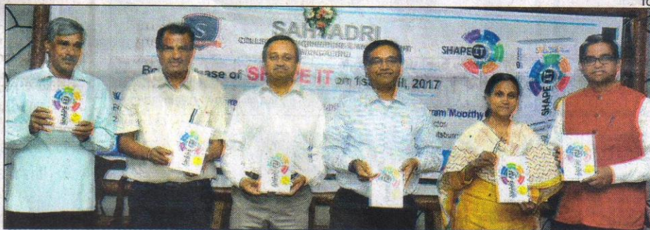
SUCCESS STORIES: Guests release the book at Sahyadri Campus in Mangaluru on Saturday